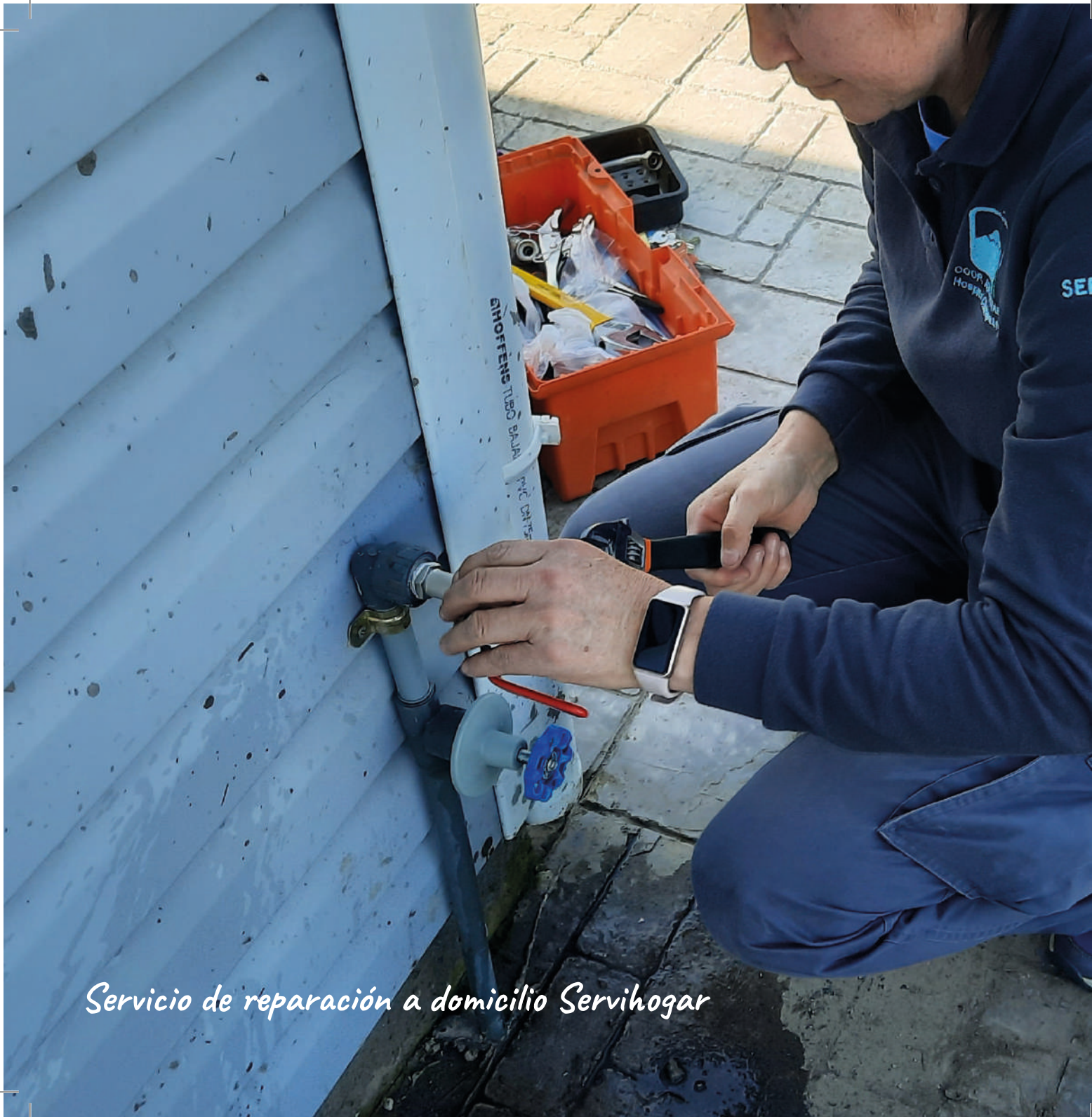
Servicio de reparación a domicilio Servihogar