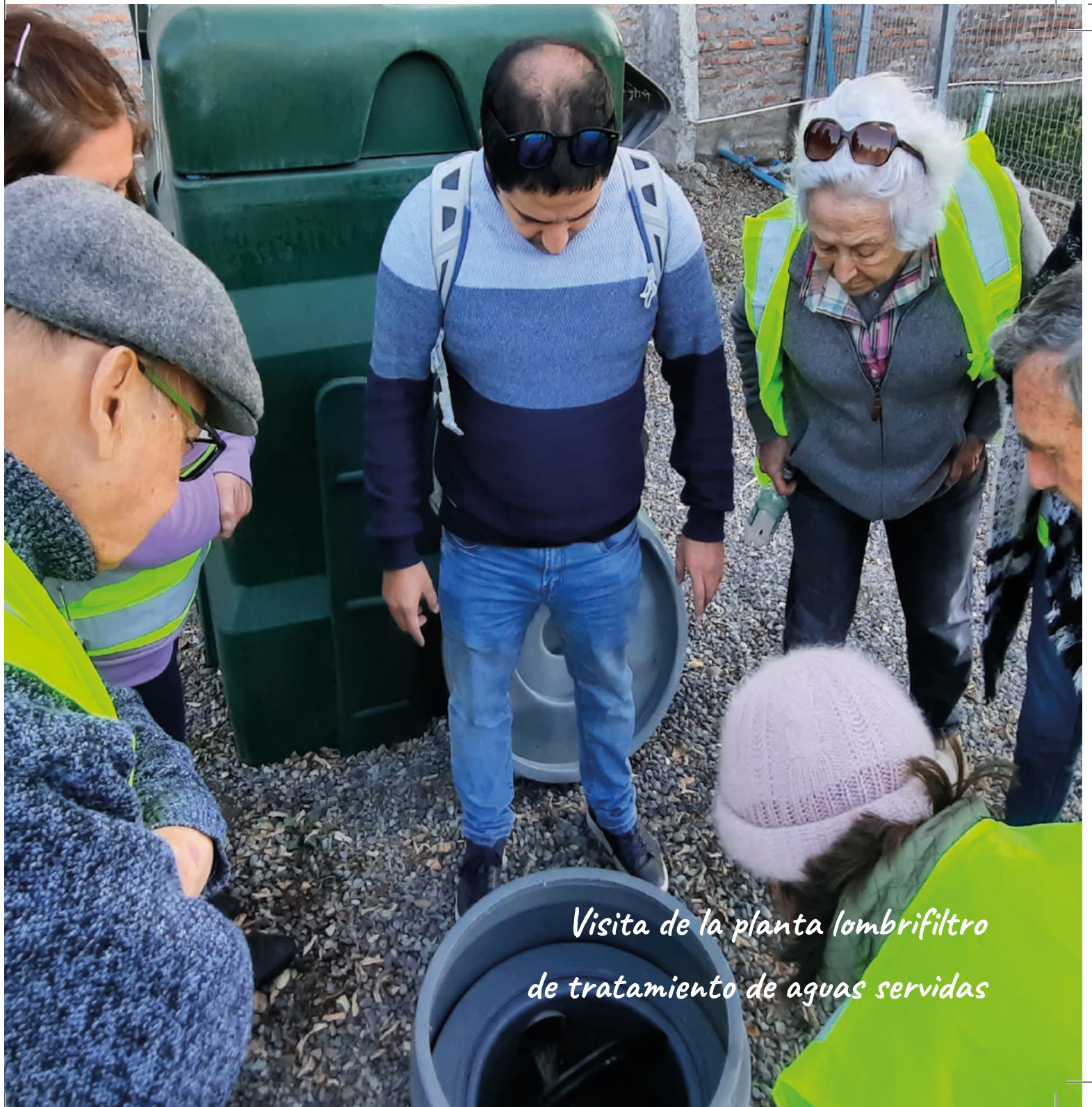
Visita de la planta lombrifiltro de tratamiento de aguas servidas