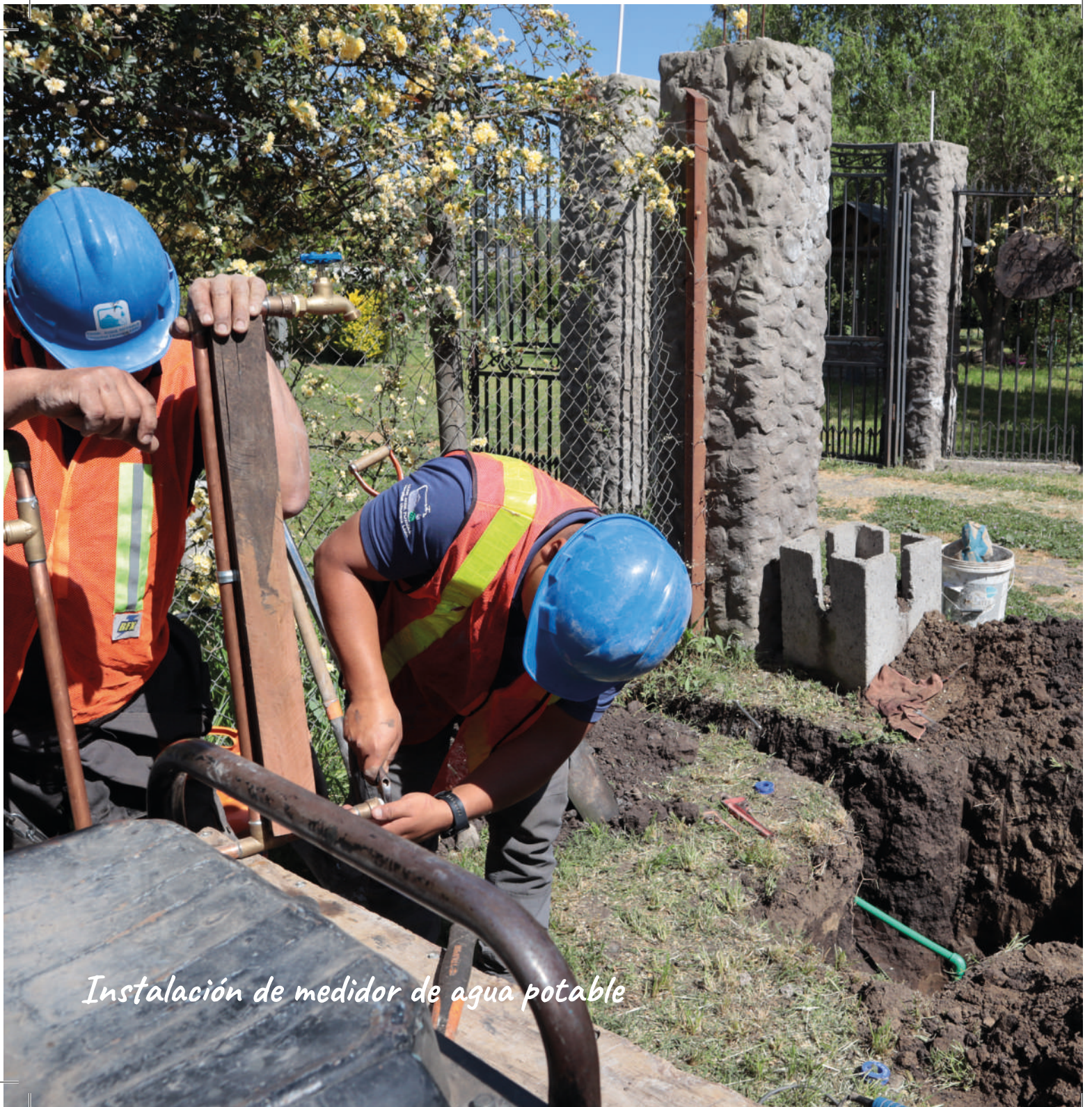
Instalación de medidor de agua potable