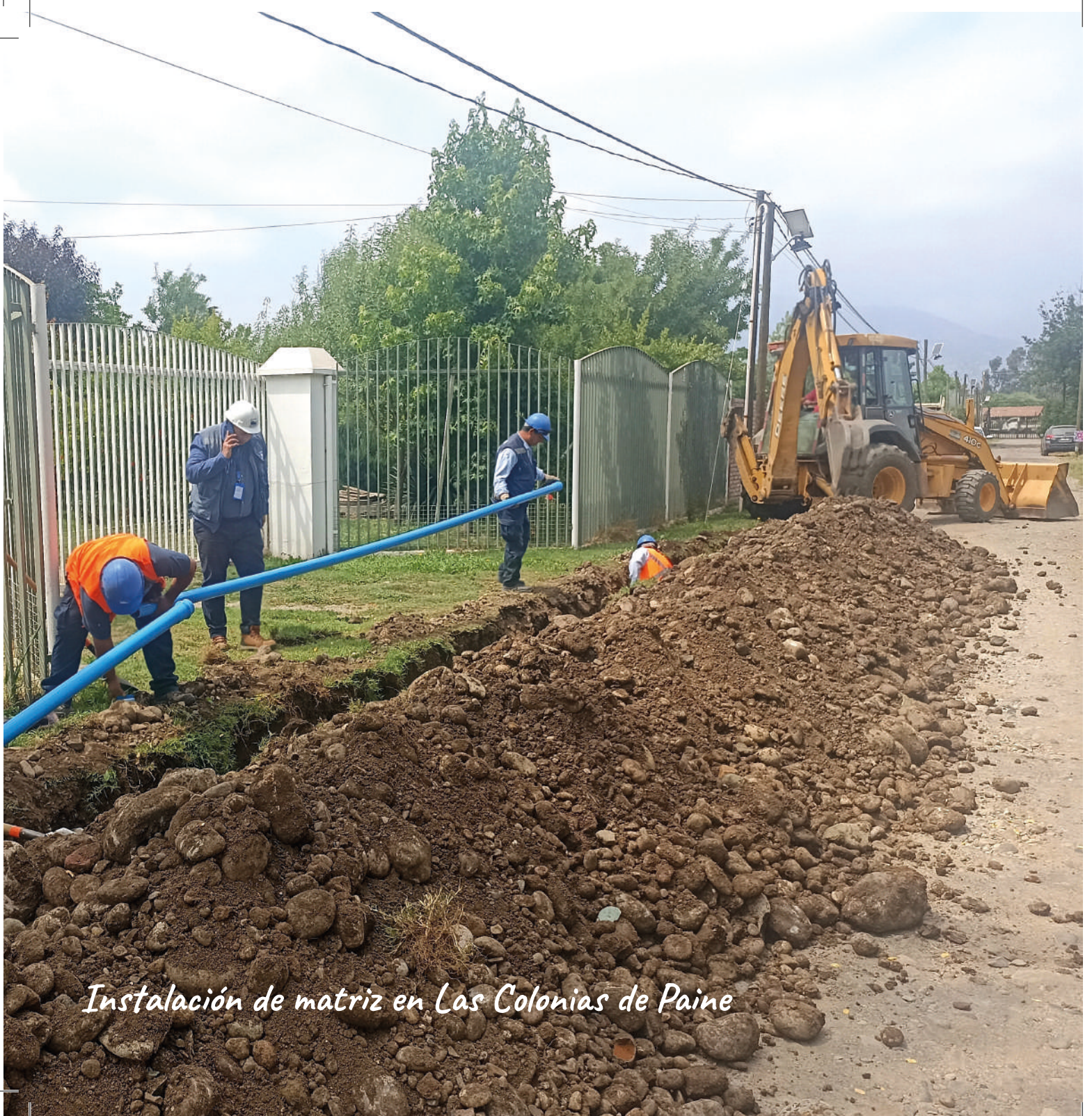
Instalación de matriz en Las Colonias de Paine