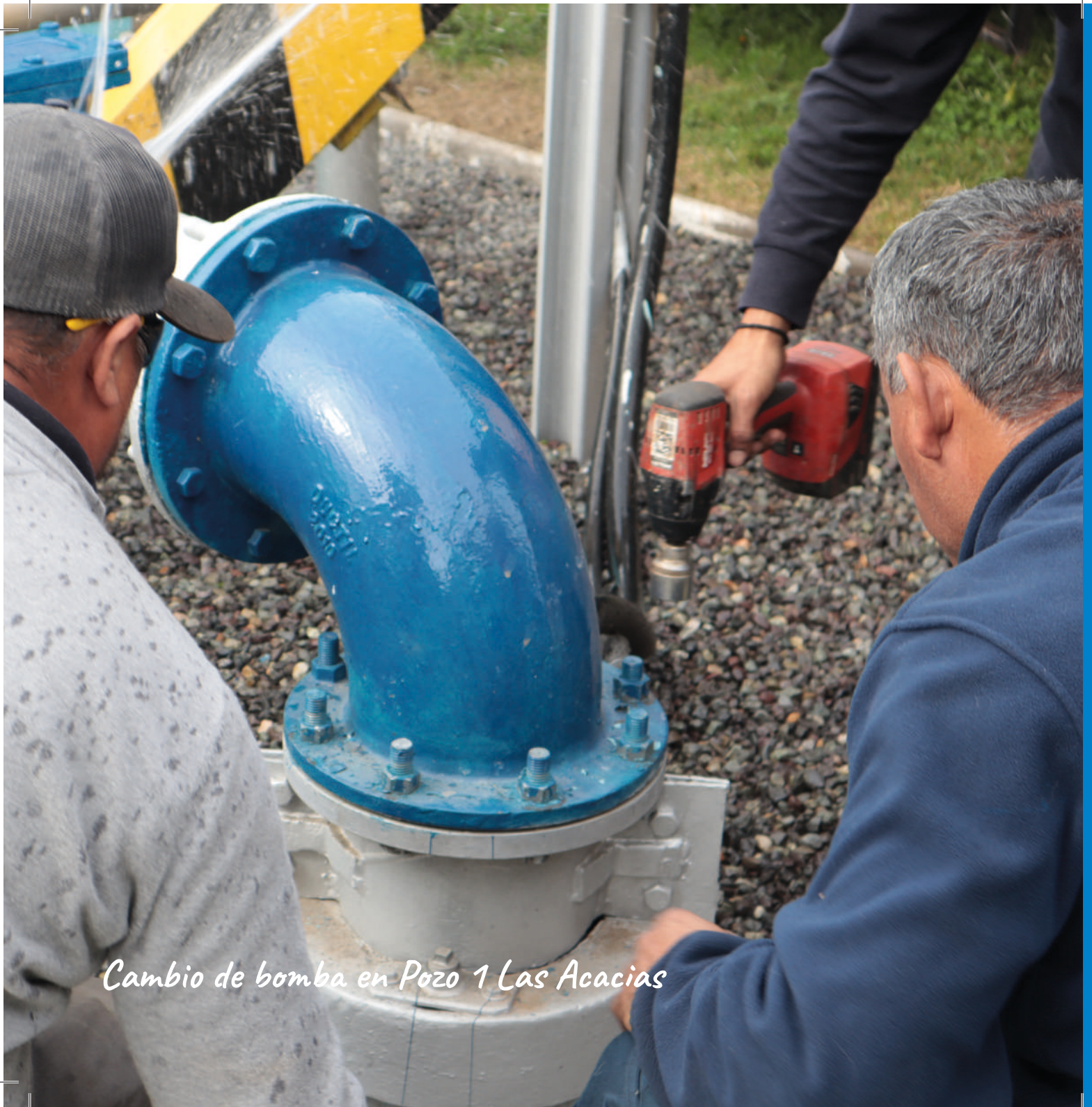
Cambio de bomba en Pozo 1 Las Acacias